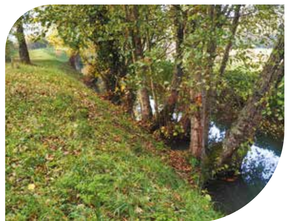
Le ruisseau du Courneau à Montussan.