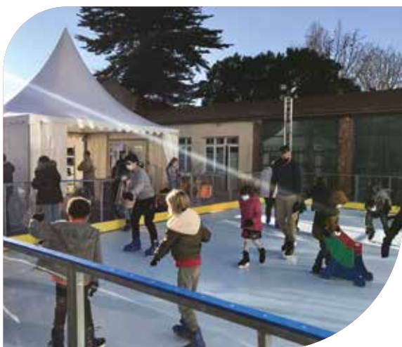
Patinoire éphémère à Saint-Loubès du 18 décembre au 2 janvier. À l'instar du chemin du Trappeur installé à Yvrac début décembre, elle a créé beaucoup d'animation pour les enfants (et les parents !). Les deux équipements ont été financés par la Communauté de communes.