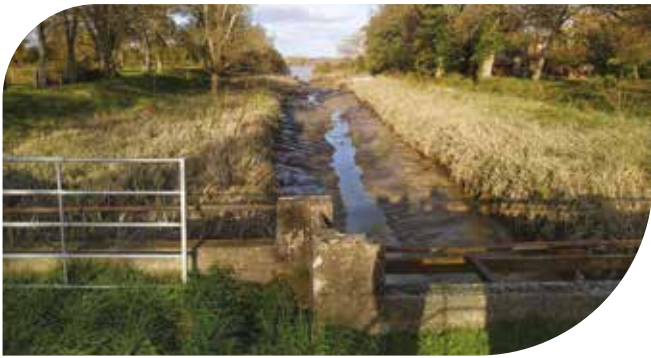
L'embouchure de la Laurence, qui se jette dans la Dordogne (visible au fond) à Saint-Loubès.