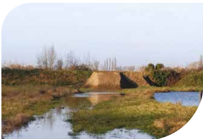
Renforcement des digues à Saint-Loubès.