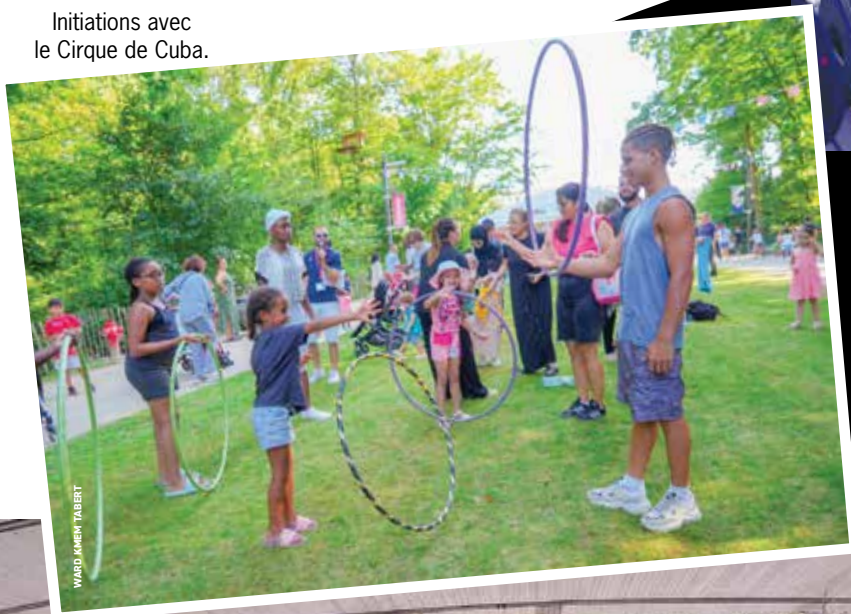
Initiations avec le Cirque de Cuba.