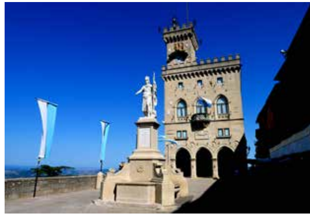
AU COEUR DU POUVOIR SAINT-MARINAIS, LE PALAIS PUBLIC ET LA PLACE DE LA LIBERTÉ, AUTRE SYMBOLE DU PAYS.