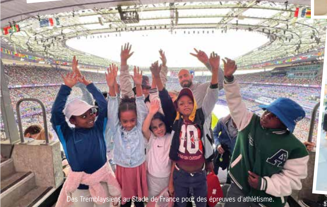
Des Tremblaysiens au Stade de France pour des épreuves d'athlétisme.