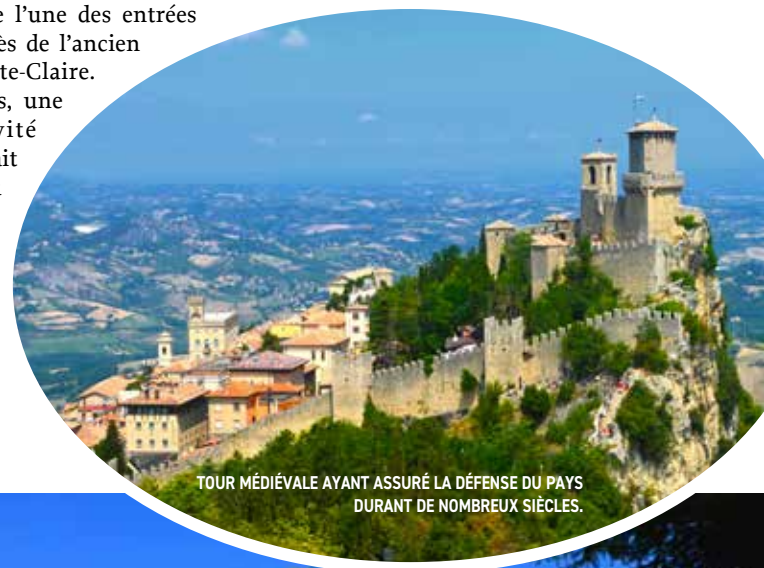
TOUR MÉDIÉVALE AYANT ASSURÉ LA DÉFENSE DU PAYS DURANT DE NOMBREUX SIÈCLES.