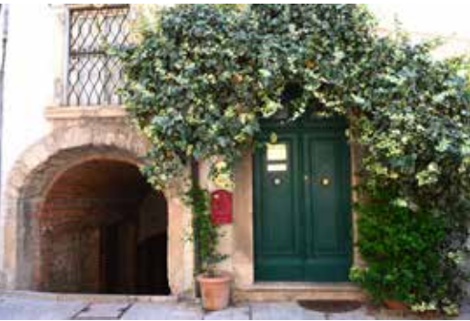
UNE HABITATION DANS LE CENTRE HISTORIQUE DE SAINT-MARIN.