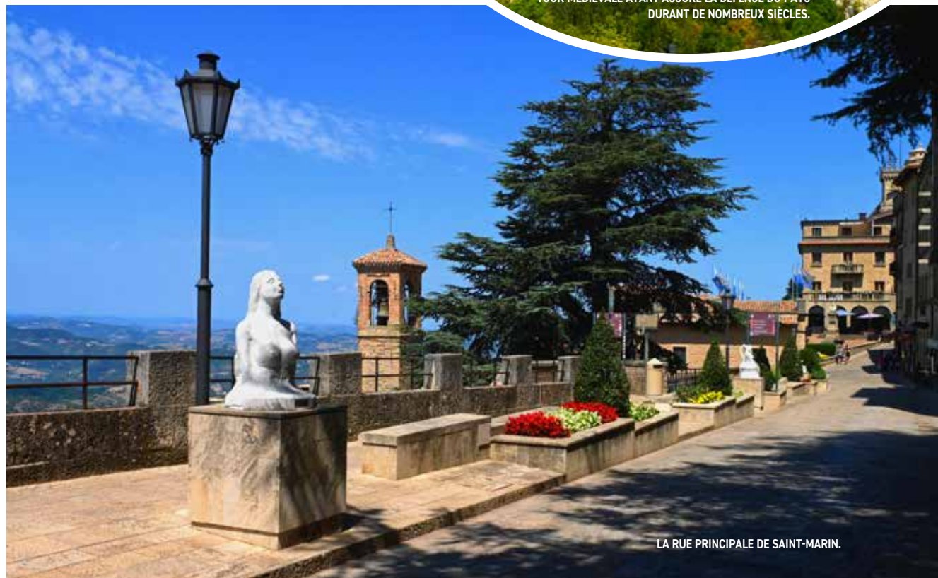
LA RUE PRINCIPALE DE SAINT-MARIN.