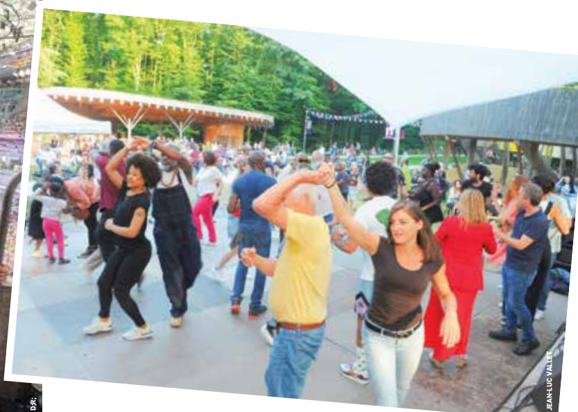
Concert du groupe Parisongo.