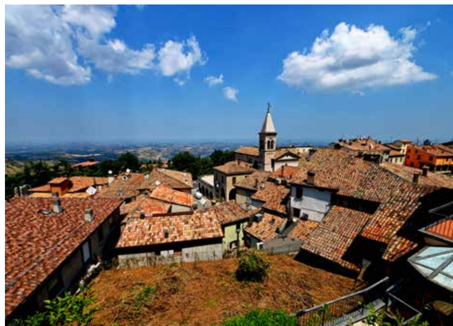
LE PITTORESQUE VILLAGE DE BORGO MAGGIORE.

Au sommet du mont Titan : le sommet de l'État, avec ses ministères, basiliques, couvents, musées