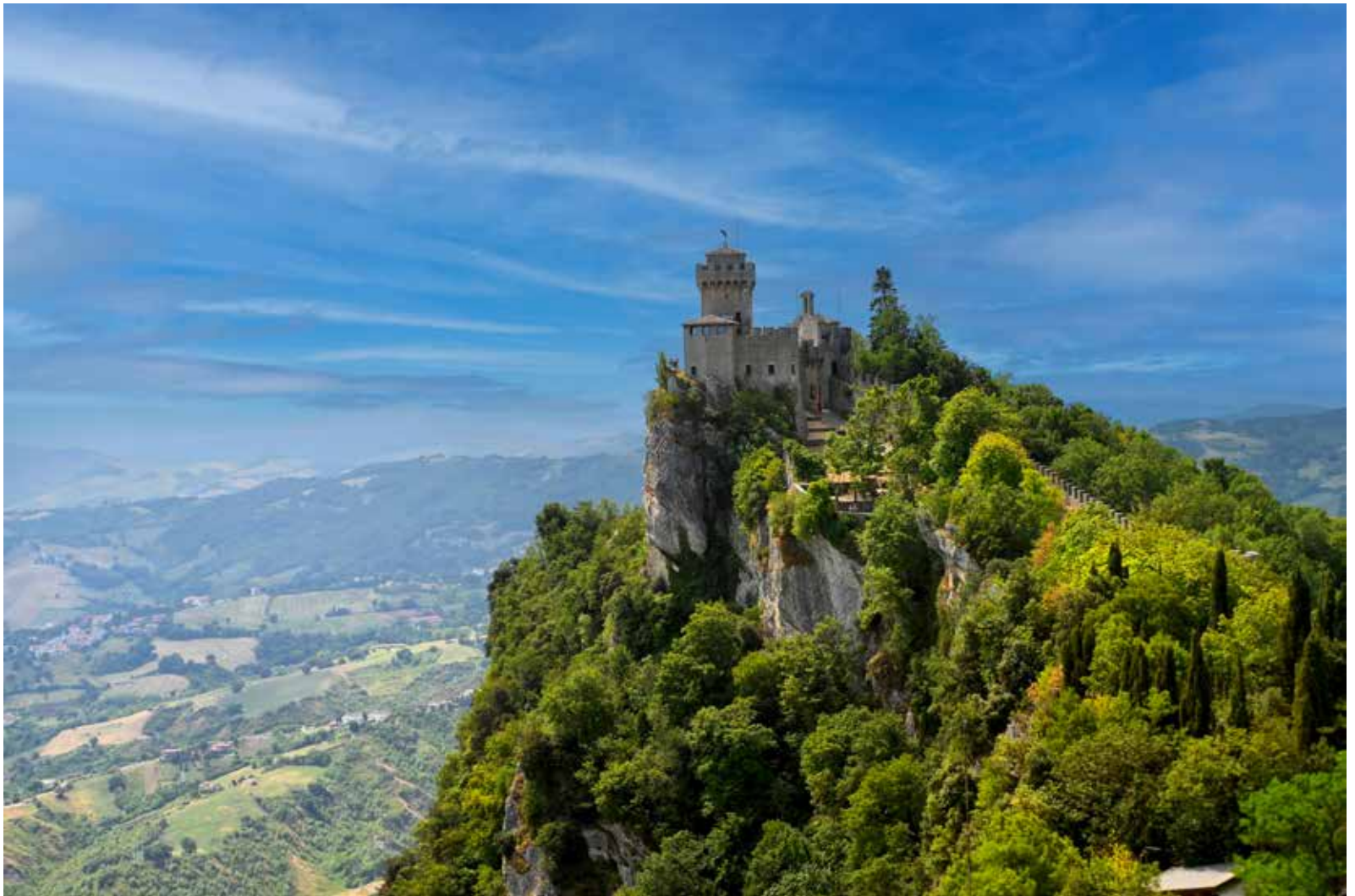
TOUR DÉFENSIVE QUI VALUT SON INDÉPENDANCE AU PAYS.

34 000 Saint-Marinais et Saint-Marinaises vivent dans la République de Saint-Marin dont la devise « Liberté » s'explique par le fait qu'elle s'est créée en 301 en toute indépendance à l'égard du pape et de l'empereur de Byzance.