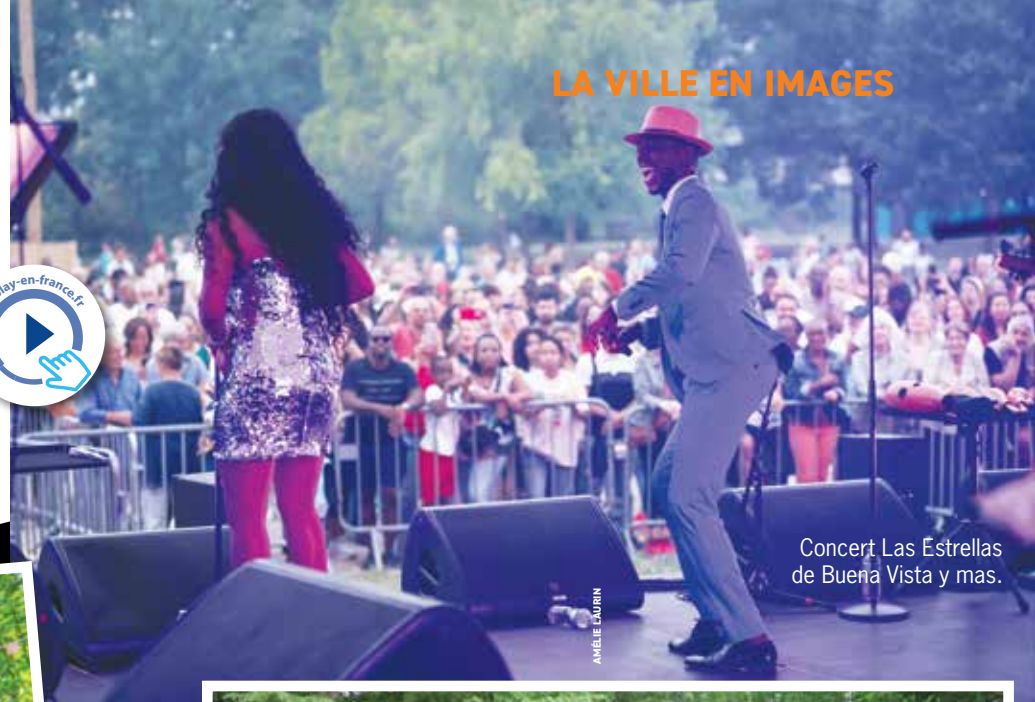
Concert Las Estrellas de Buena Vista y mas.