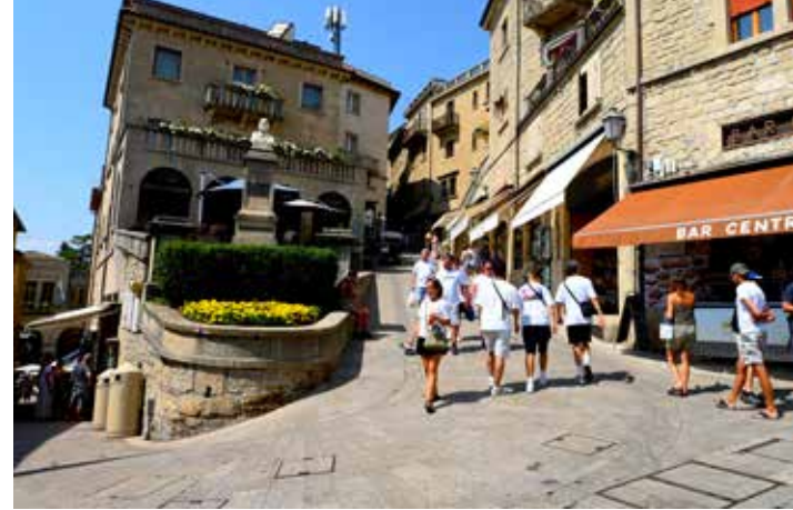
PEU DE TOURISTES VISITENT SAINT-MARIN, MAIS SUFFISAMMENT POUR REMPLIR LES RUES DE LA PETITE VILLE.

et centre du pouvoir... Des édifices médiévaux parfaitement conservés sont ordonnés avec harmonie le long de rues étroites dépourvues de voitures. La capitale qui porte le nom du pays ne démerite pas son classement au patrimoine mondial de l'Unesco. Mais un pays dont les sports nationaux sont le jonglage de drapeaux et le tir à l'arbalète n'attire manifestement pas les foules. On est loin de l'effervescence touristique de Venise. Cependant, le peu de visiteurs a vite fait d'engorger le centre historique. Ce petit paradis fiscal ne possède ni gare ni aéroport. Pour s'y rendre il faut traverser par la route une partie de l'Europe, les Alpes et l'Italie. Le panorama s'ouvre alors au loin sur le bleu de l'Adriatique.