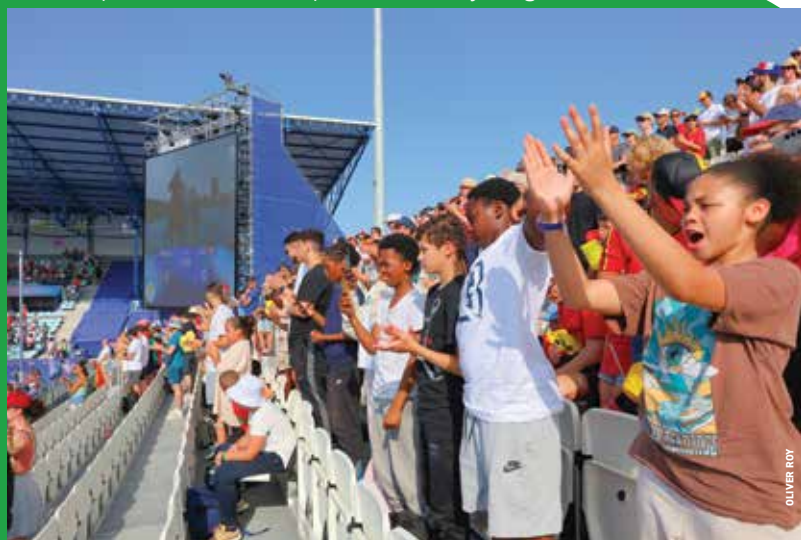
Des enfants de Sport vacances à une épreuve de hockey sur gazon à Colombes.