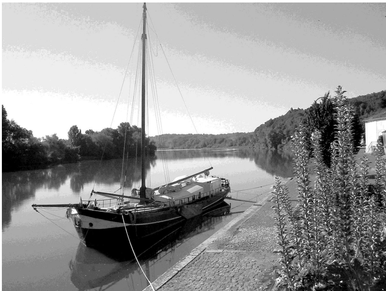
La goélette "De Dageraad" amarrée au quai de Cabara