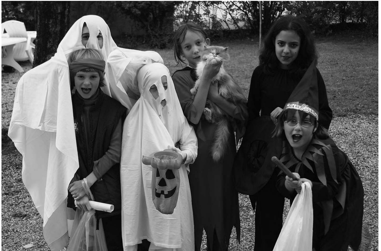
Sorcières et diables ont parcouru le village à la quête de sucreries à l'occasion d'Halloween (Photo du 31 octobre 2005)

Découvrez le site Internet de la mairie de Cabara sur :