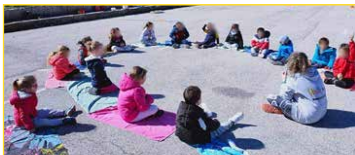
Roc Gym et le Judo loisirs se sont partagés le plateau de Basket, le Team Full Rocbaron occupe le stade de football tous les samedis pour ses entraînements de jeunes

Du coup, ne pouvant s'entraîner en espace confiné et utilisant au maximum les espaces extérieurs, les adhérents peuvent compter sur le partage des installations entre associations et la mise à disposition réglementée de lieux publics. Le beau temps revient, les jours s'allongent ce qui permet d'augmenter les créneaux et les possibilités d'entraînements. Il faut maintenant attendre la levée des contraintes et continuer à être responsable face à la maîtrise de la contagion en s'assurant des bonnes pratiques de gestes barrières. ●