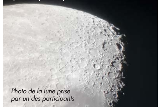
Photo de la lune prise par un des participants

Un grand merci à toutes les personnes qui ont participé.