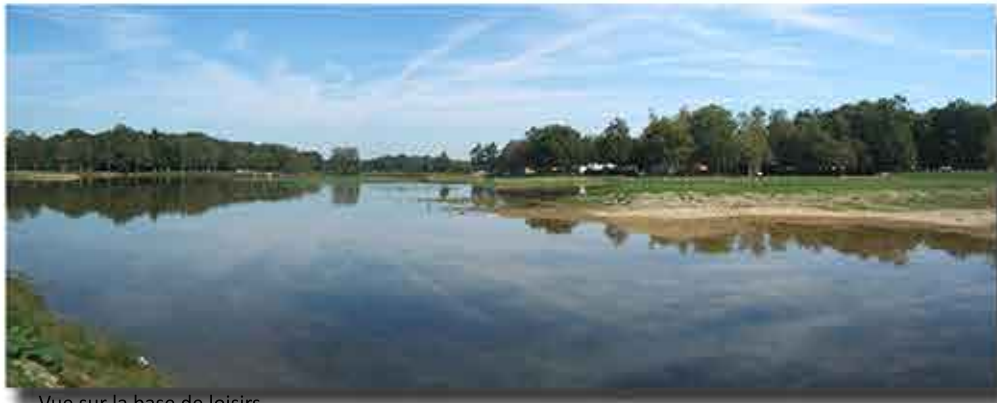
Vue sur la base de loisirs