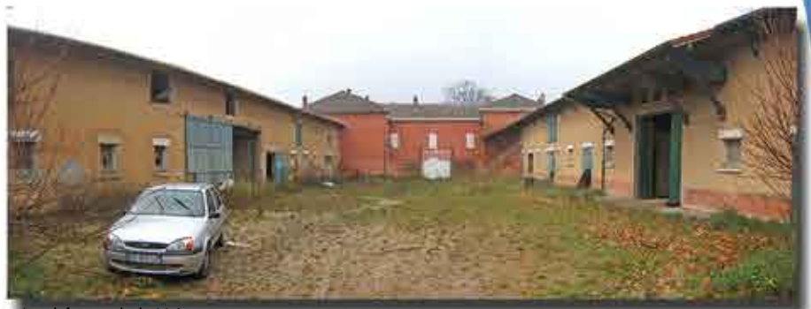
Le château de la Vaise