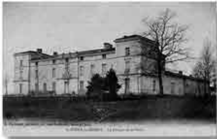
Château de St Nizier le Désert

Dossier d'Approbation de la Modification simplifiée n°1 du P.L.U