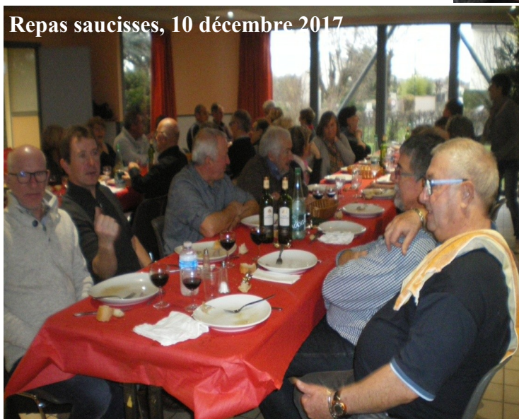
Repas saucisses, 10 décembre 2017