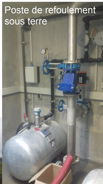
Poste de refoulement sous terre

Les eaux usées d'Unias sont à présent refoulées à l'Hôpital le Grand par une conduite de 2KM 500 de longueur avec passage en forage sous l'autoroute et un débit de 18 m 3 /h.