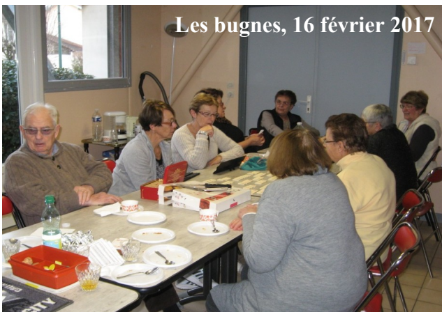
Les bugnes, 16 février 2017