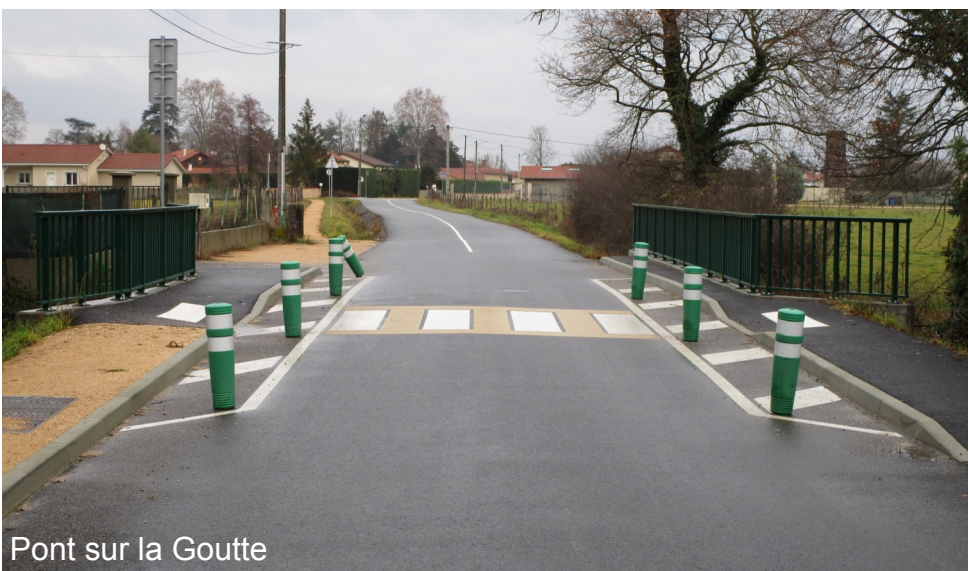
Pont sur la Goutte

Autres travaux de voirie qui se sont finalisés sur 2017 et qui améliorent également la sécurité, ce sont la reconstruction du pont sur la goutte avec un passage protégé réservé aux piétons ainsi que le reprofilage de la départementale à l'entrée sud du bourg. Ces travaux ont été financés entièrement par le département pour 225 000€.