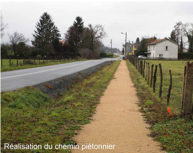
Réalisation du chemin piétonnier

2017 aura vu la finalisation du COCA (Contrat communal d'aménagement) :