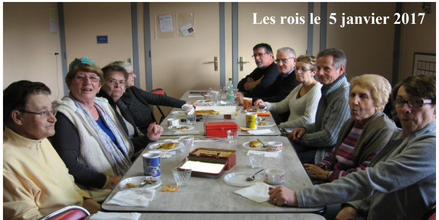
Les rois le 5 janvier 2017

Pour 2018, l'adhésion au Club reste inchangée soit 10€ .....sous enveloppe dans la boîte du Foyer Rural vers la Mairie ou au Club le jeudi : le 1 er de l'année sera le 4 janvier à 14h30 et ensuite tout les 15 jours !