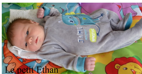
Le petit Ethan