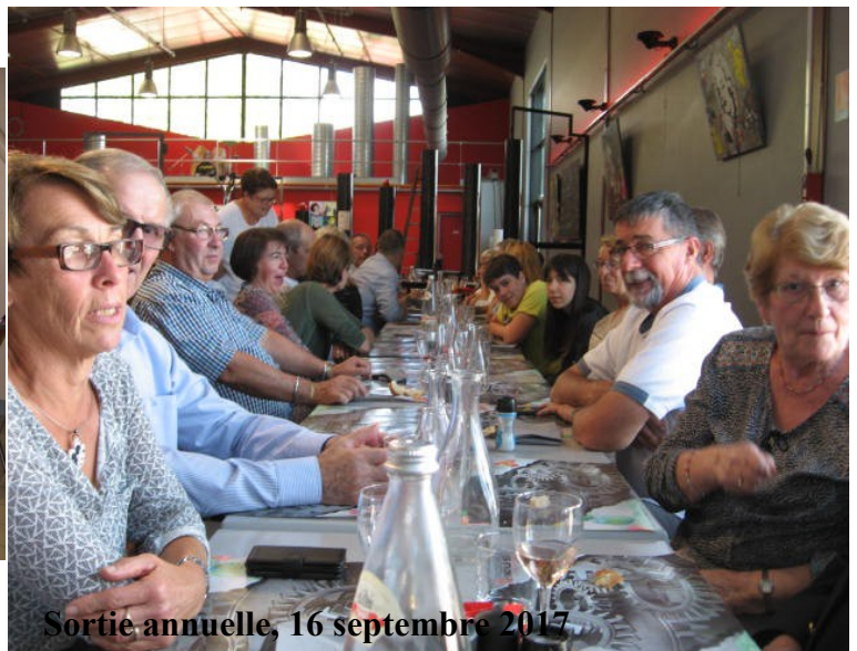
Sortie annuelle, 16 septembre 2017