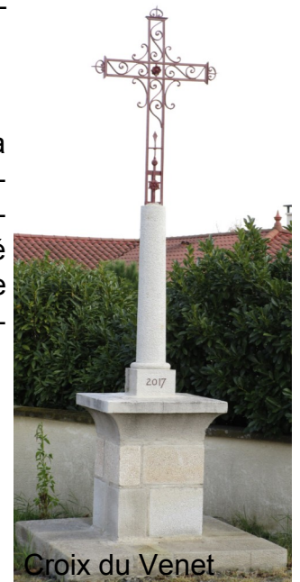
Croix du Venet

Enfin toujours dans le cadre du coca c'est la réfection en septembre de la croix du VENET par l'entreprise Art et Techniques de la pierre de SAVIGNÉUX. Tout le monde peut apprécier la qualité de cet ouvrage, pour l'histoire les pierres de taille en granit constituant le socle de cette croix ont été fournies par la commune ; elles proviennent de l'ancien pont de la goutte et auraient pour origine des carrières aujourd'hui abandonnées qui se situaient à MOINGT le long du Vizézy .