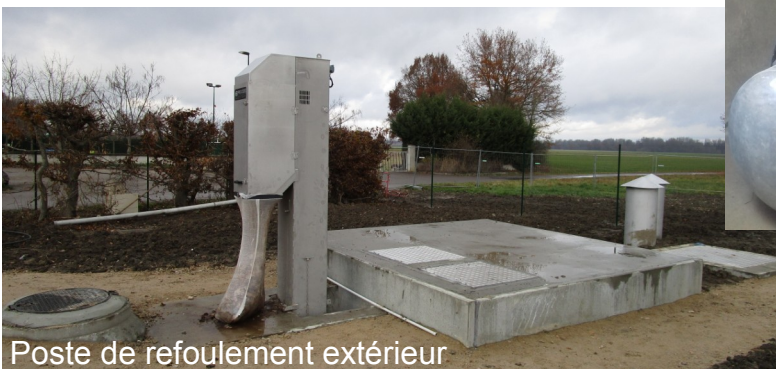
Poste de refoulement extérieur