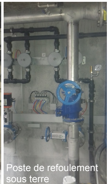
Poste de refoulement sous terre