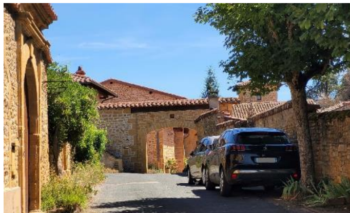
Figure 5 – Corps de ferme à Apinost

Les élus souhaitent également limiter le développement des zones pavillonnaires avoisinant le bourg et les hameaux pour conserver le concept de village densifié évoqué dans le SCOT.