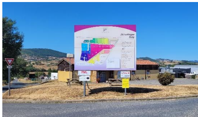
Figure 7 – Zone d'activité de la Plagne

L'objectif étant d'élever le ratio emplois/actifs sur le territoire, pour ne pas amplifier le volume des déplacements domicile/travail et donc répondre aux objectifs du SCoT.