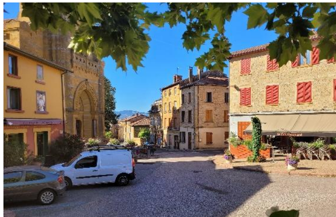
Figure 1 - Commerces dans le centre-ville

Les élus veulent favoriser le maintien et le développement de cette richesse dans la centralité commerciale et respecter ainsi le concept de « village densifié » défini dans le SCOT.