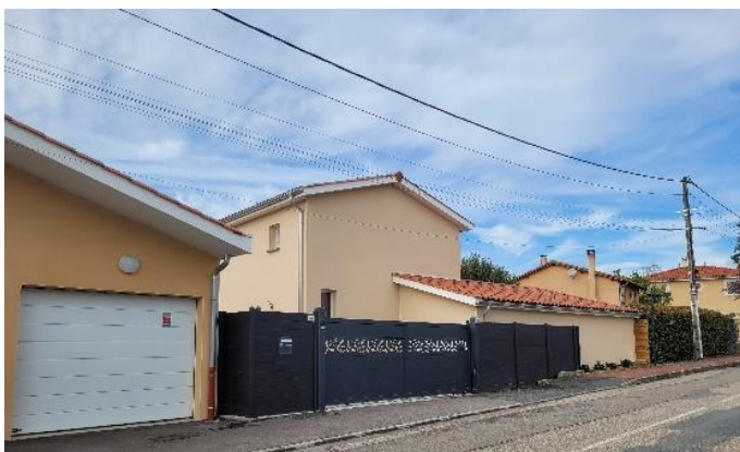
Figure 6 : Logement récent

Les « dents creuses » actuelles permettent d'envisager la production d'environ 35 logements. Les changements de destination permettent d'envisager la production d'environ 8 logements. Les projets en cours, permis de construire accordés et en cours de validité représentent une production de 8 logements supplémentaires. Le potentiel offert par les dents creuses, les changements de destination et les projets en cours représente ainsi un total d'environ 51 logements.