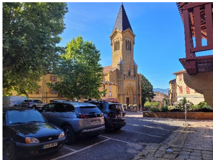
Figure 3 – Eglise Saint-Polycarpe à Bully

La commune présente plusieurs éléments relatifs au patrimoine bâti et paysager que les élus veulent préserver pour les intérêts architecturaux qu'ils représentent. Les différents corps de fermes et bâtiments construits en pierre dorée font partie, au même titre que le Château de Bully, la mairie ou l'église Saint-Polycarpe, des éléments architecturaux remarquables du territoire. La municipalité veut que ce patrimoine d'intérêt soit relevé et protégé dans le PLU. Les bâtiments agricoles présentant un intérêt patrimonial peuvent voir leur destination changer afin de préserver le patrimoine qu'ils représentent.