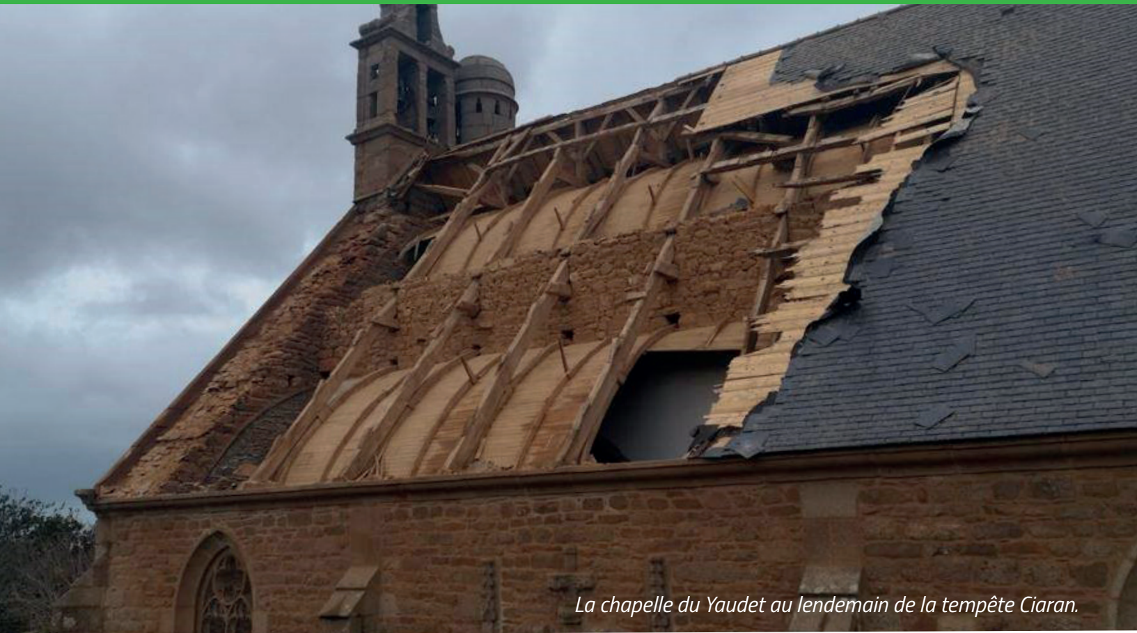
La chapelle du Yaudet au lendemain de la tempête Ciaran.