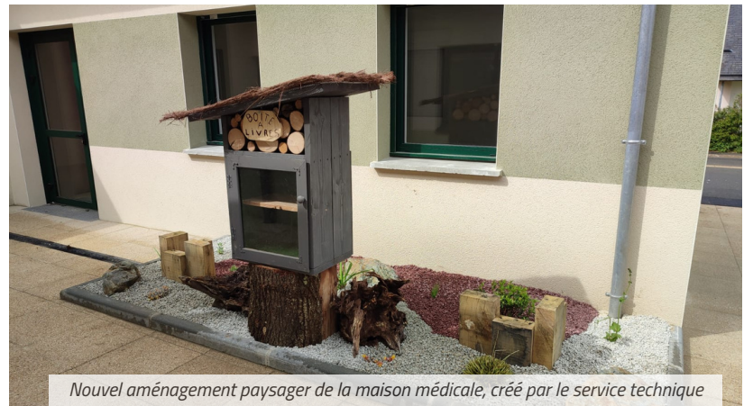
Nouvel aménagement paysager de la maison médicale, créé par le service technique