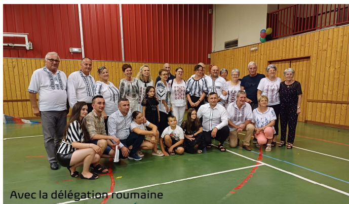
Avec la délégation roumaine