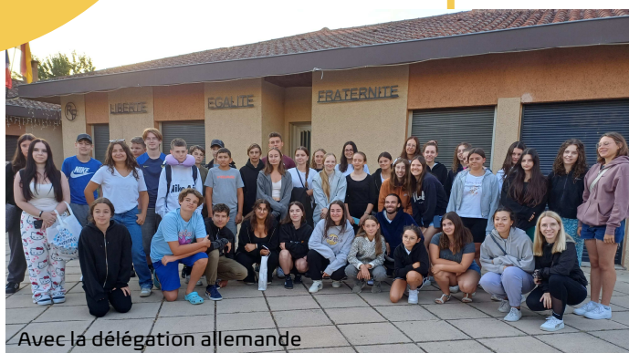
Avec la délégation allemande