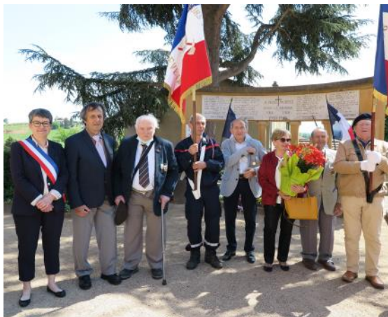
Cérémonie commémorative du 8 mai

Lors de la cérémonie du 8 mai, les enfants du village ont lu le texte « Liberté » de Paul Eluard et on déposé des fleurs bleues et jaunes en soutien à l'Ukraine.