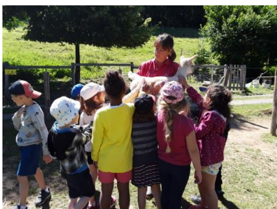
Ferme des lamas

Les classes de maternelle sont quant à elles allées visiter la Ferme des Lamas à Chambost-Longessaingne.