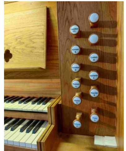
Tout est prêt pour ces deux jeux supplémentaires!

Bel été à tous ... et si pendant vos vacances vous voyez de belles orgues, n'hésitez pas à les prendre en photo et à nous les envoyer !