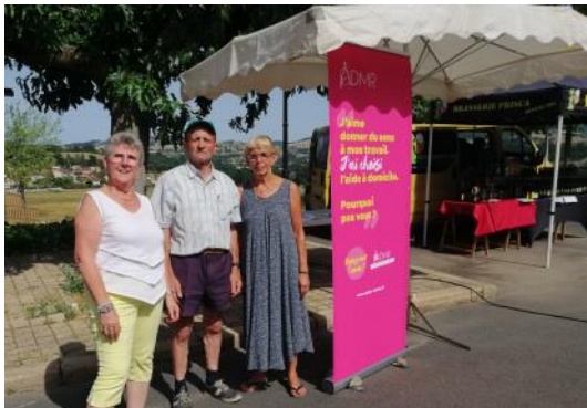
Présentation de l'ADMR

Nous accueillons depuis le 10 juin Julio et ses spécialités portugaises. Alors n'hésitez pas à venir goûter et tester accras et beignets pour vos apéros d'été par exemple.