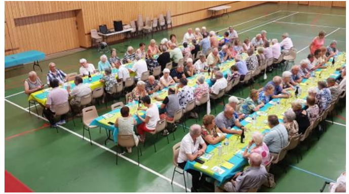
Repas du CCAS