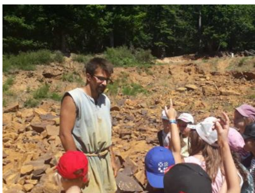
Château de Guedelon

Cette année, grâce au soutien financier de la mairie et de l'APE, les élèves de l'école des Sources ont eu la chance de partir pendant une semaine au mois de juin en classe verte : au programme, visite des châteaux de la Loire et Zoo de Beauval.