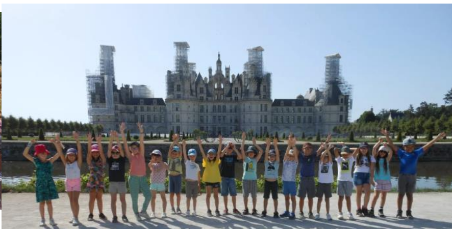
Château de Chambord