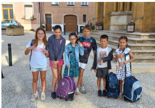
Les enfants du pédibus 2021-2022