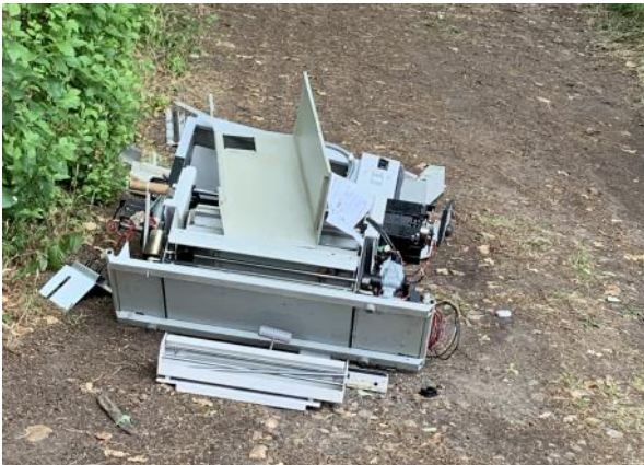
Déchets abandonnés vers Persanges