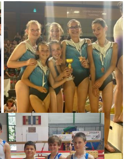
Garçons 5ème et Louis 2ème

Pour les groupes loisirs se fut une compétition interne au club organisée en février, avec de belles prestations, du plaisir et des sourires sous les encouragements des parents.