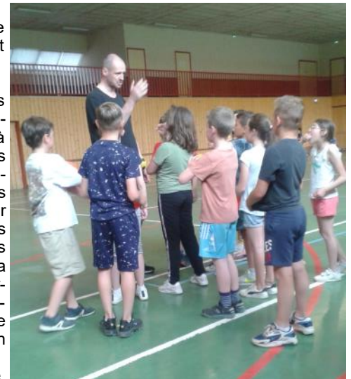
Découverte du handball