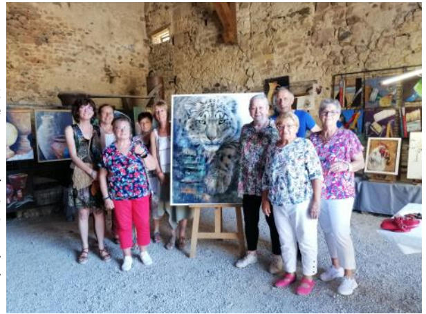
Exposition au Cuvier les 11 et 12 juin 2022