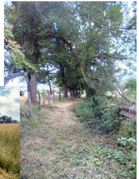
Balade Savigny-Sain Bel