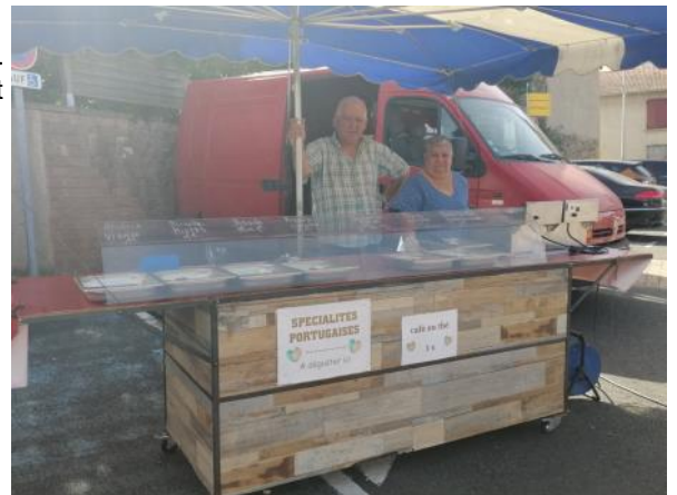
Stand de spécialités portugaises

Le marché, c'est aussi l'occasion pour les associations de se faire connaître et de présenter leurs activités. Ce fut le cas de l'ADMR le 17 juin.