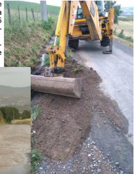
Travaux sur les bas côtés

Concernant le ralentisseur sur la route de Sain Bel, au niveau du croisement vers le pont Barraquin, l'étude se poursuit avec plusieurs scénarios, des devis ont été demandés.