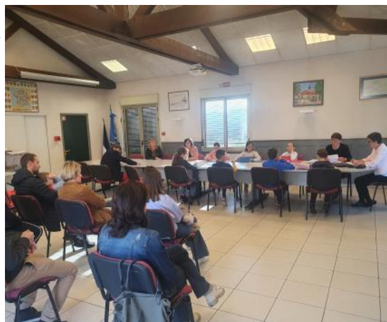
1er Conseil Municipal des enfants le 22 octobre