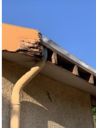
Toit de l'école maternelle

Réfection de la toiture et de l'isolation ainsi que divers travaux qui étaient bien nécessaires.