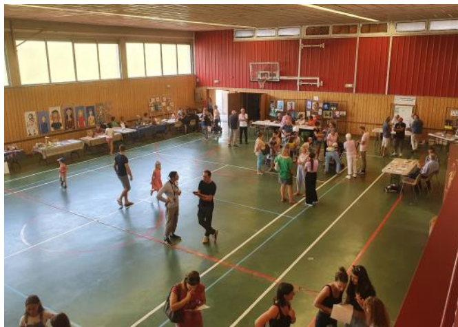
Forum des associations