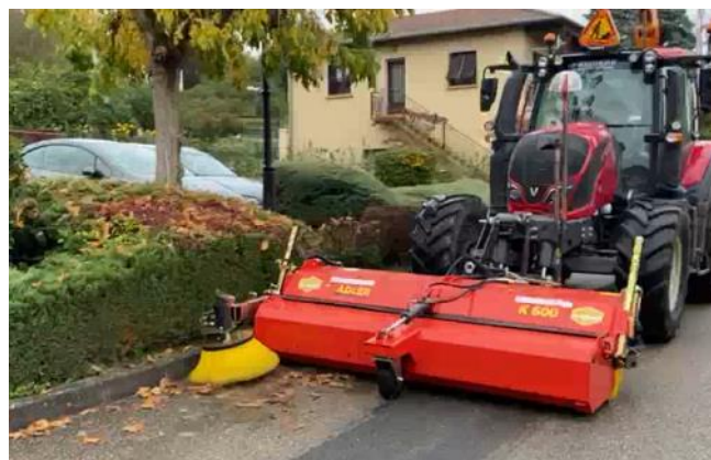
La balayeuse en action

Le CAUE (conseil d'architecture, d'urbanisme et de l'environnement) doit nous remettre une proposition d'aménagement ce mois ci. Cette proposition intégrera la synthèse des suggestions de la population faites dans le cadre du sondage et de la réunion participative.