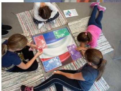
Exposition et animations autour de la Citoyenneté