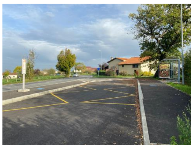
Arrêt de bus Route du Bois du Maine