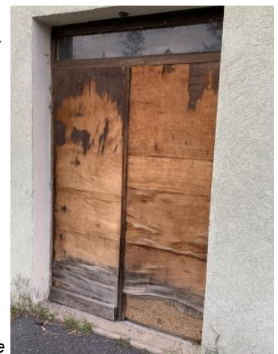
Porte abîmée salle du Trésoncle

Salle du Trésoncle : réfection d'une des portes extérieures.