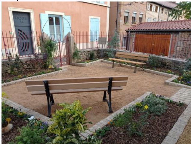
Et après !