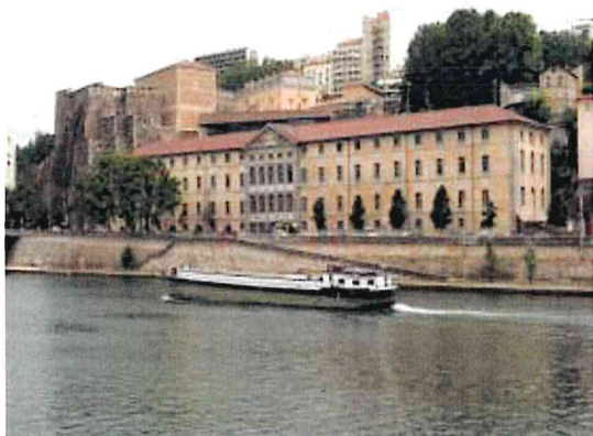
UDAP 69 - DRAC Auvergne-Rhône-Alpes