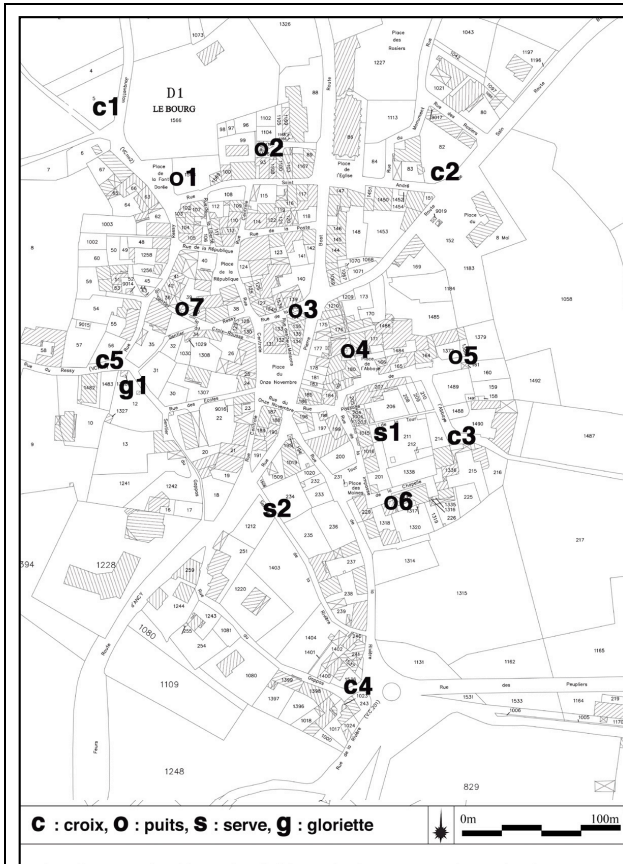
Carte de localisation du petit patrimoine